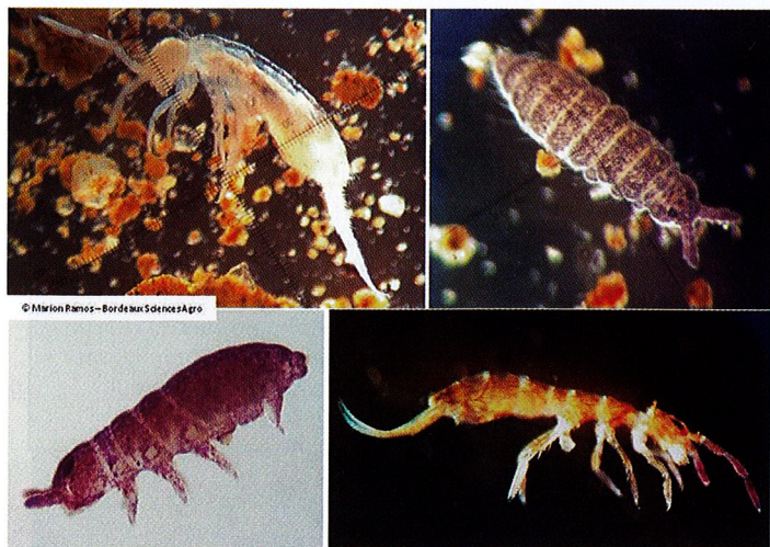
Figure 4 : Photographies de différents morphotypes de Collembolés échantillonnés en parcelles viticoles dans le Libournais (33).