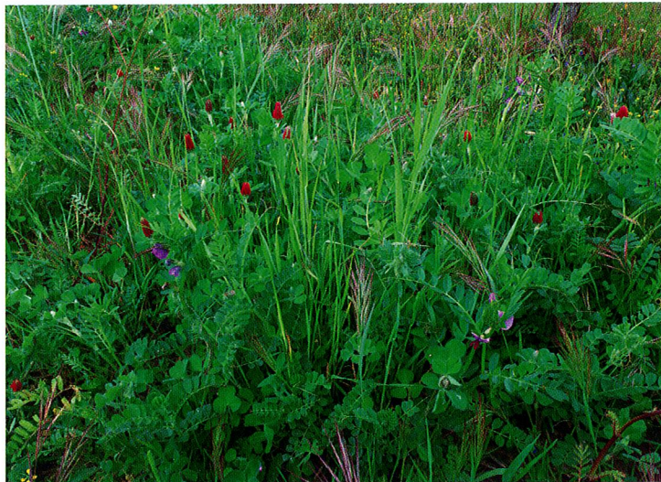
Exemple de mélange engrais vert semé en inter-rang (vesce, trèfle incarnat et avoine).

des enzymes produites par les microorganismes montrent également une diminution forte et significative dans les zones dégradées. La vitesse de décomposition de la matière organique a été mesurée dans ce projet en enfouissant des sachets de thé industriels pendant 90 jours dans le sol. Cette mesure ne semble pas montrer de grandes différences entre zones dégradées et non-dégradées. Des recherches