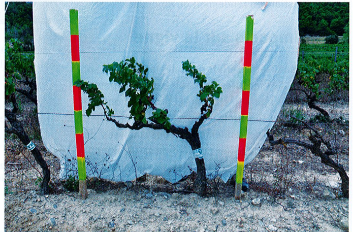
Figure 1. Pied de vigne en zone dégradée

En viticulture conventionnelle comme en biologique, il est courant de rencontrer au sein des parcelles des zones caractérisées par des vigueurs faibles, des pertes de récolte ou encore de qualité (Figure 1). Ces problèmes sont très souvent liés à une perturbation du fonctionnement du sol. Celle-ci peut avoir comme origine une préparation du sol inappropriée avant plantation et/ou une gestion inadaptée. Les ceps peuvent alors souffrir de carences en nutriments (éléments majeurs comme éléments traces). La préparation pré-plantation peut induire un déficit hydrique ou une mauvaise aération du sol qui peuvent être liés à des phénomènes de compaction de certains horizons. Des phénomènes d'érosion ou d'accumulation de sédiments dans les parcelles peuvent également perturber les couches de sol, les cycles de décomposition de la matière organique