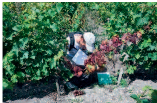
Prospection du vignoble