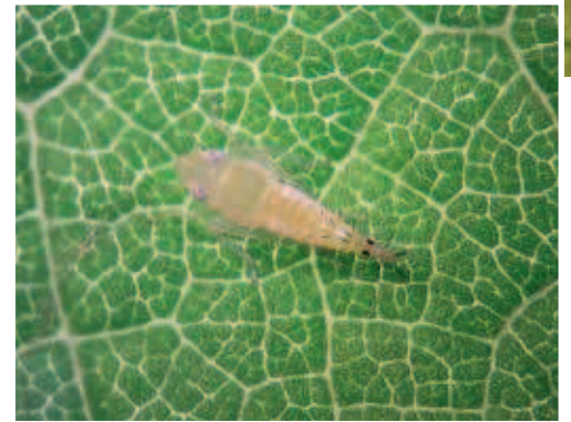
Larve de Scaphoideus titanus