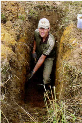
Figure 3 : Prélèvement d'un échantillon dans une fosse pédologique

Contrairement à ce que l'on pourrait attendre, on ne retrouve pas forcément des populations élevées de nématodes vecteurs sur une parcelle arrachée pour cause de viroses. De plus, les foyers de nématodes peuvent évoluer différemment selon l'espèce vectrice détectée. Identifier les espèces présentes et leur niveau de population permet donc d'adapter la durée du repos du sol.