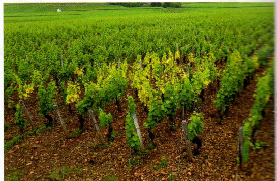
Figure 1 : Symptômes de panachure du court-noué

L a maladie du court-noué de la vigne, virose transmise par des nématodes, provoque d'importants dégâts dans tous les vignobles du monde. Les symptômes visibles de panachures ne sont que le sommet de l'iceberg. Des travaux débutés en 2004 à l'Enita en partenariat avec plusieurs laboratoires de l'Inra et avec l'ARD-VD* ont permis d'acquérir de nouvelles connaissances et de développer des diagnostics pour mieux gérer cette problématique